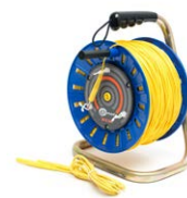
Cavo 200 m sulla bobina per misure di terra giallo