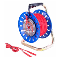
Cavo 100 m sulla bobina per misure di terra rosso