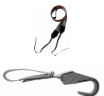
Laccio per misuratore (tipo M-1)