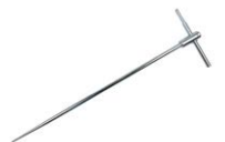
Sonda da piantare nel suolo (80 cm)