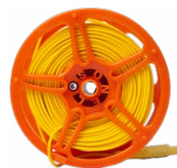
Cavo 40 m / 50 m / 60 m / 80 m sulla bobina per misure di terra (terminale banana) giallo

WAPRZ040YEBSZ WAPRZ050YEBSZ WAPRZ060YEBSZ WAPRZ080YEBSZ