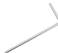
4x sonda da piantare nel suolo 25 cm WASONG25