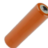
4x batterie alcaline 1,5 V AA, LR6