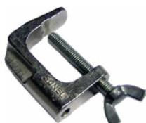
Morsetto a vite (terminale banana)

WAPRZ040YEBSZ WAPRZ050YEBSZ WAPRZ060YEBSZ WAPRZ080YEBSZ